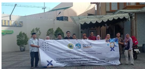
Gambar 3. Foto bersama pengurus masjid Al-Ikhlas

Hasil kuesioner menunjukkan bahwa mayoritas responden (66,67%) merasa aplikasi mudah digunakan, sementara 33,33% merasa sangat mudah. Tidak ada responden yang merasa kesulitan dalam menggunakan aplikasi. Ini membuktikan bahwa antarmuka aplikasi yang ramah pengguna berperan penting dalam meningkatkan pengalaman pengguna.