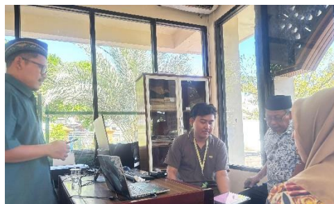
Gambar 4. Sosialisasi aplikasi mozak

Terkait keamanan, 46,67% responden merasa aplikasi sangat aman, dan 46,67% lainnya merasa cukup aman. Hanya 6,67% yang merasa aplikasi kurang aman. Ini menunjukkan bahwa meskipun mayoritas pengguna merasa aplikasi ini aman, terdapat ruang untuk meningkatkan aspek keamanan, yang mungkin terkait dengan perlindungan data pribadi.