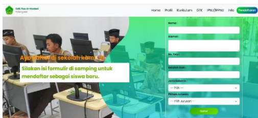
Gambar 5. Tampilan menu Pendaftaran Peserta Didik Baru