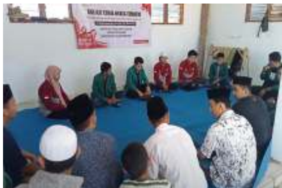
Gambar 3. Kegiatan Sosialisasi Pentingnya Hak Atas Tanah

35 orang yang hadir pada acara Sosialisasi Pentingnya Sertiifikat Tanah dan Peralihan Hak Atas Tanah ke BPN, terdapat hampir keseluruhan masyarakat Desa Rombuh tidak memiliki sertifikat tanah, orang yang belum memiliki disebabkan tidak paham prosedur pembuatannya dan dikarenakan tidak paham dan tidak adanya biaya untuk membiaya untuk membuat atau mengurus sertifikat tanah.