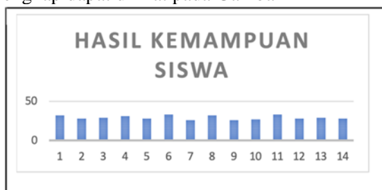
Gambar 1. Hasil Tes Kemampuan Siswa

Hasil kemampuan siswa secara lebih lengkap dapat dilihat pada Gambar 1