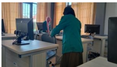
Gambar 4. Mengecek lab komputer sekolah

tidak bisa. Untuk proses mengecek lab komputer yang ada di sekolah bisa dilihat pada Gambar 4