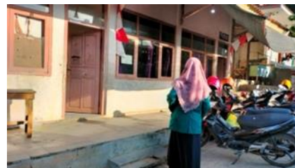
Gambar 2. Survei Lokasi

Sebelum dimulai pengabdian ini tahapan awal yang dilakukan yaitu melakukan survei lokasi ke tempat pengabdian yang akan dilaksanakan. Proses survei lokasi seperti pada Gambar 2.