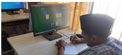
Gambar 5. Pemberian pre test pada siswa

Tahapan berikutnya yaitu tahapan pelaksanaan, tahapan pelaksanaan dilakukan pada minggu kedua dan ketiga. Pada minggu kedua diberikan pretest pada siswa untuk mengukur kemampuan siswa dalam memahami terkait e-dokumen dan surat menyurat secara digital.