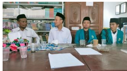
Gambar 3. Komunikasi dengan pihak sekolah

Selanjutnya melakukan komunikasi dengan pihak sekolah terkait pelatihan yang akan dilakukan di sekolah tersebut respon pihak sekolah sangat baik karena selama ini sekolah masih menggunakan sistem dokumen dan surat menyurat digital secara manual juga siswa di MA Noer Fadilah masih belum pernah ada pelatihan terkait e-dokumen dan surat menyurat menggunakan word otomatis. Selanjutnya dilakukan perundingan terkait waktu yang tepat untuk pelatihan dengan pihak sekolah agar tidak menggunakan aktivitas siswa dalam melakukan kegiatan belajar mengajar (KBM).