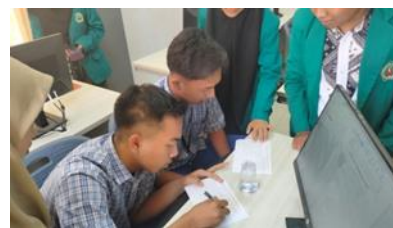
Gambar 8. Pemberian post test pada siswa

Pada tahapan terakhir yaitu tahapan monitoring dan evaluasi yang dikemas dengan pemberian post test kepada siswa setelah pelatihan berlangsung yang bertujuan untuk mengukur pengetahuan siswa terkait e-dokumen dan surat menyurat secara digital setelah diadakannya pelatihan.