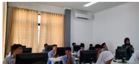
Gambar 7. Uji coba dokumen dan surat menyurat otomatis

Pada minggu ketiga dilanjutkan dengan pemberian uji coba pembuatan Ms. Word dalam mengolah e-dokumen dan surat menyurat secara otomatis kepada siswa juga pemberian materi mengenai pengembangan e-dokumen dan surat menyurat digital dengan google drive sekolah. Proses uji coba dokumen otomatis pada siswa dapat dilihat pada Gambar 7.