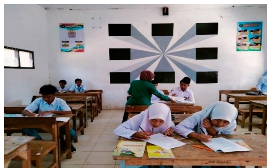
Gambar 2. Pemberian pretest

Kegiatan pengabdian Masyarakat ini pada awal pertemuan melakukan penyebaran pretest dengan menggunakan 20 pernyataan untuk mengetahui minat belajar sebelum siswa diberikan perlakuan (Gambar 2).