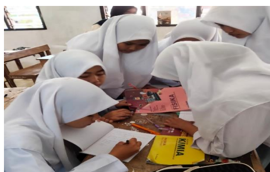
Gambar 3. Pelaksanaan eksperimen

Setelah pemberian pretest selesai, dilanjutkan dengan pemberian materi terkait cara kerja, bagian-bagian pengukuran (jangka sorong dan mikrometer sekrup) dan perhitungan angka penting. Selanjutnya, masuk pada kegiatan inti yakni pelaksanaan eksperimen (Gambar 3).