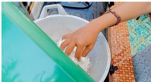
Gambar 3 : Tangkapan Layar video Proses Pembuatan T-Nyor (Te ghetteh Nyior)

mengacu pada penjemuran setelah di kukus. Alat dan bahan yang dibutuhkan dalam pembuatan manggula cake adalah; kelapa, gula pasir, vanili, pewarna makanan, kompor, wajan/teflon, spatula, parutan kelapa/keju, wadah/ mangkok, dan kemasan ukuran 12 x 25 cm. Tahapan pembuatan manggula cake sebagai berikut: 1). Kupas kulit kelapa menggunakan pisau yang tajam. 2). Cuci buah kelapa sampai bersih. 3). Parut kelapa menggunakan parutan keju. 4). Setelah itu, siapkan wajan/teflon. 5). Lalu, masukkan gula pasir kedalam wajan/teflon, dan campurkan sedikit air. 6). Aduklah air dan gula tersebut hingga larut. 7). Setelah itu, masukkan parutan kelapa, lalu campurkan sedikit vanili ke dalam wajan/teflon. 8). Aduklah hingga merata sampai gula dan kelapa menggumpal. 9). Setelah parutan kelapa tadi menggumpal maka angkat T-Nyor (Te ghetteh Nyior) dan bentuklah sebuah kue. 10). Jemur lah hingga 2-6 jam. 11). Setelah T-Nyor (Te ghetteh Nyior) kering, maka langkah selanjutnya yaitu poses pengemasan. Berikut tangkapan layar video pembuatan T-Nyor (Te Getteh) Nyior: