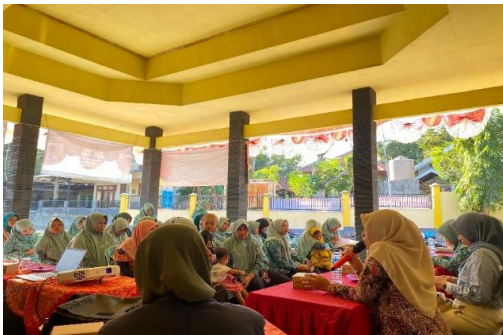
Gambar 1: Kegiatan Sosialisasi Inovasi produk.

manfaat bisnis dan usaha di era digital ini untuk mamajukan perekonomian secara nasional dan pelatihan inovasi produk dari Sumber Daya Alam yang ada di desa Bungbaruh. Mitra pada pelaksanaan pengabdian ini adalah ibu-ibu PKK Desa Bungbaruh yang berjumlah 50 orang. Namun, sebelum tahap pelaksanaan pengabdian dilakukan pretest terlebih dahulu dengan mengajukan 3 pertanyaan terkait pemahaman ibu-ibu PKK tentang usaha atau bisnis. Setelah pretest dilaksanakan, selanjutnya dilakukan sosialisasi tentang manfaat bisnis dan usaha serta strategi pemasaran secara online ( digital marketing ) yang akan berpengaruh kepada peningkatan UMKM dan penjualan UMKM sehingga akan meningkatkan perekonomian keluarga pada khususnya dan perekonomian nasional pada umumnya. Kegiatan sosialisasi yang dilakukan sebagai berikut :