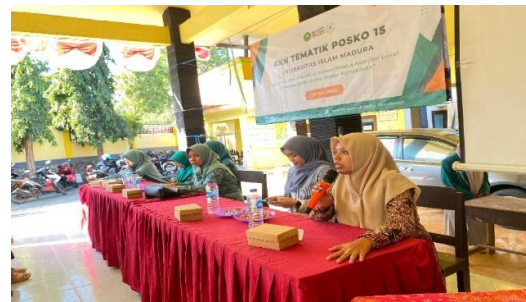
Gambar 2 : Pelatihan Pembuatan inovasi produk T-Nyor (Te Getteh) Nyior

Setelah melakukan kegiatan sosialisasi inovasi produk dan digital marketing , selanjutnya dilakukan kegiatan pelatihan pembuatan inovasi produk yaitu T-Nyor (Te Getteh) Nyior yang berasal dari Kelapa, pada kegiatan ini hanya dijelaskan tentang cara pembuatan T-Nyor (Te Getteh) Nyior dan juga menampilkan video proses pembuatan T-Nyor (Te Getteh) Nyior serta memberikan tester inovasi produk T-Nyor (Te Getteh) Nyior kepada ibu-ibu PKK. Hal ini dilakukan karena waktu pembuatan produk yang membutuhkan waktu yang lama. Berikut Pelaksanaan pelatihan pembuatan inovasi produk T-Nyor (Te ghetteh Nyior):