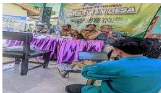
Gambar 2. Koordinasi ke Perangkat