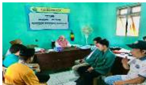
Gambar 1. Koordinasi Ke Kepala Desa

Persiapan yang dilakukan sebelum program utama melibatkan komunikasi intensif dengan mitra program, yaitu kepala desa, perangkat desa, dan masyarakat Desa Klompang Timur. Tim KKN melakukan Koordinasi awal untuk menjelaskan tujuan dan manfaat program, serta memperoleh masukan dari masyarakat mengenai kebutuhan spesifik mereka terkait BUMDes. Persiapan peralatan meliputi pengadaan modul pelatihan, alat tulis, proyektor, dan laptop. Selain itu, sarana-prasarana pendukung seperti tempat pelatihan dan logistik juga disiapkan. Strategi pelaksanaan program dijelaskan secara bertahap dengan memprioritaskan sesi pengenalan konsep BUMDes, penyusunan Perdes, dan praktik simulasi.