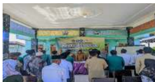
Gambar 3. Pelatihan Penyusunan Perdes

Strategi pelaksanaan program melibatkan penerapan ilmu pengetahuan dan teknologi terapan untuk memberikan pelatihan kepada mitra. Pelatihan ini meliputi penyampaian materi tentang BUMDes, teknik penyusunan Perdes, dan sesi simulasi. Keaktifan, peran, dan kontribusi mitra sasaran sangat ditekankan pada setiap tahap pelaksanaan program. Masyarakat dan perangkat desa dilibatkan secara aktif dalam diskusi dan praktik penyusunan Perdes, sehingga mereka tidak hanya memahami konsep tetapi juga mampu menerapkannya secara mandiri