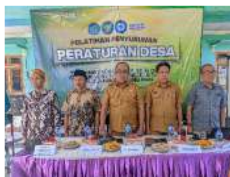
Gambar 7. Pemateri Pendampingan BUMDes