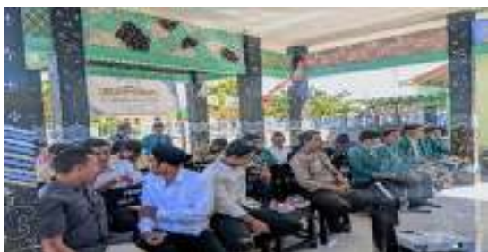
Gambar 4. Partisipasi Perangkat desa dan Tokoh Masyarakat