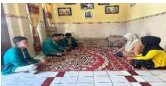
Gambar 5. Proses monitoring dan evaluasi

efektivitas pelatihan. Hasil evaluasi dianalisis untuk menentukan keberhasilan program dan area yang memerlukan perbaikan. dilakukan oleh tim KKN.