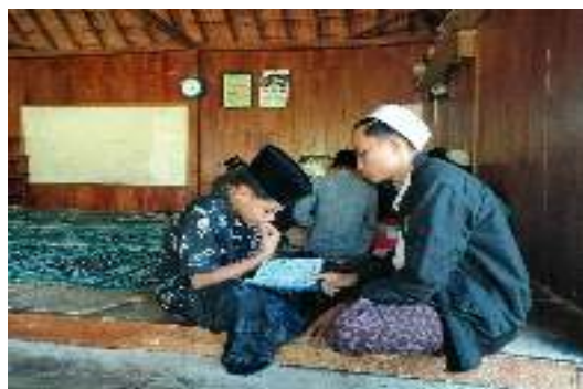
Gambar 5. Pengecekan santri

sekaligus memberikan pertanyaan-pertanyaan seputar tentang ilmu tajwid dan diakhir Minggu ini saya langsung menerapkan ilmu tajwid menggunakan kitab Al Qur'an saya mengetes setiap santri dengan cara mengaji dan sekarang para santri sudah lebih memahami terhadap hukum bacaan tajwid dan akan berguna bagi mereka dalam kegiatan sehari-hari.