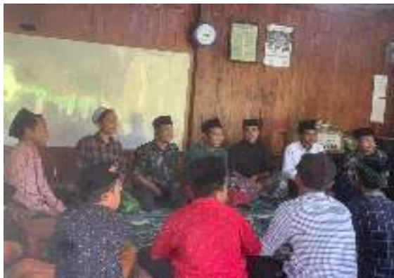
Gambar 1. Kondisi saat observasi

Peningkatan kemampuan santri dalam memahami hukum-hukum bacaan ilmu tajwid merupakan hal yang sangat positif dan relevan karena perkembangan zaman ini banyak anak-anak yang melupakan jaran ilmu tajwid tersebut karena kebanyakan mereka lebih fokus terhadap pembelajaran ilmu – ilmu umum. Maka penjelasan berikut merupakan uraian dari pembelajaran ilmu tajwid Hidayatus sibyan menggunakan flashcard dalam program KKN ini: