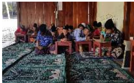
Gambar 4. Kondisi saat pembelajaran

Yang dimana media flashcard ini menjelaskan hukum bacaan- bacaan tajwid, disini para santri lebih antusias dalam belajar menggunakan media ini karena tidak hanya menarik tapi juga terdapat inovasi baru sehingga para santri ingin belajar dan juga lebih tertarik dalam media pembelajaran ini.