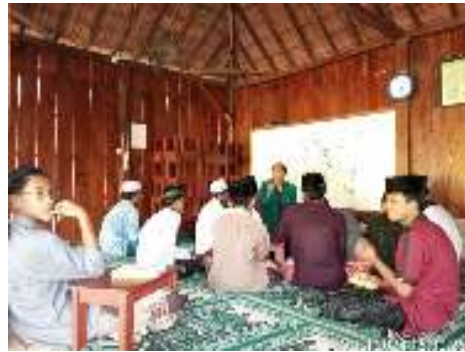
Gambar 2. Kondisi pembelajaran

Minggu pertama tim pengabdian melakukan observasi terhadap yayasan pendidikan dakwah dan sosial Al wahid pada hari jumat tanggal 19 juli 2024 mengamati dan bertanya terhadap apa saja kekurangan dan tantangan dalam pembelajaran yang diterapkan disana, dan ternyata tantangannya adalah para santri kurang memahami terhadap pelajaran ilmu tajwid Hidayatus sibyan karena mereka kebanyakan tidak suka atau bosan dengan metode pembelajaran tersebut sehingga mereka dalam membaca Al Qur'an tidak menerapkan hukum bacaan tajwid. Dari satu kelas ini terdiri dari 6 santri yang tidak paham terhadap ilmu tajwid Hidayatus sibyan.