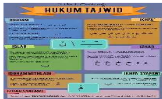
Gambar 3. Gambar media flash card

Minggu kedua kita menerapkan pembelajaran dengan inovasi baru yakni dengan belajar hukum bacaan tajwid Hidayatus sibyan menggunakan media flash card dalam Minggu ini kami fokus memberikan penjelasan tentang pentingnya belajar ilmu tajwid Hidayatus sibyan dan juga lebih fokus terhadap santri yang tidak faham terhadap ilmu tajwid.