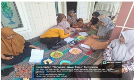
Gambar 3 : Monitoring dan Evaluasi

Pelaksanaan monitoring dan evaluasi kegiatan ini dilakukan sejauh mana berpengaruh terhadap peningkatan omzet penjualan dengan kebiasaan anggota dulu hanya sebatas penjualan secara tradisional akan tetapi adanya bentuk upaya tersebut bisa meningkatkan penjualan nantinya.