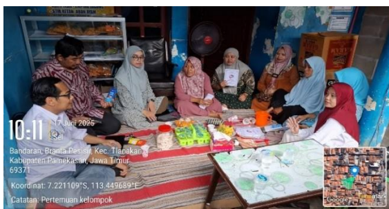
Gambar 1 : Koordinasi dan Sosialisasi bersama para anggota Poklhasar

Poklhasar untuk melakukan persiapan PKM ini. Dimulai dengan mempertemukan kami tim PKM dengan para anggotanya untuk melakukan karena selama ini belum pernah membahas program ini kepada anggotanya langsung hanya melalui Ketua Poklhasar saja agar nantinya tidak ada kesalahpahaman diadakan pengabdian kepada masyarakat ini.