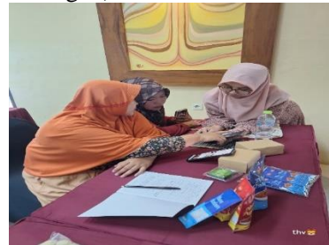
Gambar 2: Kegiatan Pelatihan dan Pendampingan Pengelolaan Manajemen Keuangan.

Poklhasar mempraktekkan membuat pencatatan keuangan sederhana dengan 3 tahapan yakni membuat pencatatan keuangan secara manual, setelah itu mempraktekkan menggunakan computer, dan menggunakan pencatatan keuangan menggunakan aplikasi sederhana di android masing-masing aplikasinya adalah sepran. Isi dari soal pretest dan post test 10 soal dengan bobot masing-masing 10 point kalau mereka bisa mempraktekkan satu persatu soal dan apabila belum bimbingan yakni diberikan dengan bobot 5. Untuk kriteria penilaian “bisa” berbobot 80 – 100 point, sedangkan untuk bobot nilai 75 kebawah dikategorikan “cukup” (perlu bimbingan).