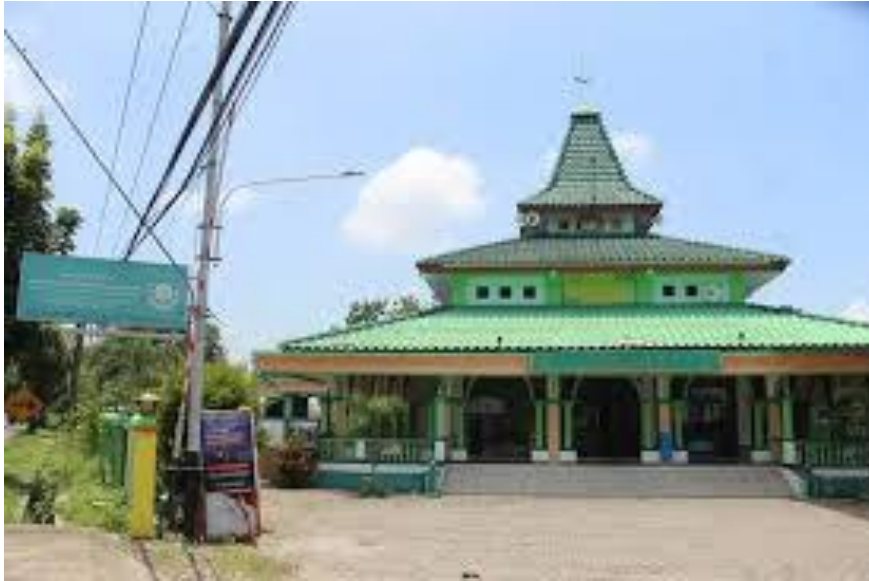
Gambar 3. Ilustrasi gambaran halaman luas mesjid yang berpotensi digunakan sebagai pusat pemasaran produk UMKM masyarakat desa