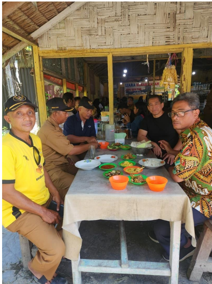
Gambar 7. Kepala Desa menjamu Tim Pelaksana PkM USU setelah kegiatan selesai

Masyarakat bergotong royong membuat alas kios UMKM sehingga memudahkan selama program penjualan mereka dan tidak mengganggu lalu lalang masyarakat karena kios ini ditempatkan di pinggir jalan utama desa dengan tujuan kemudahan akses pengunjung untuk berbelanja ke lokasi ini.