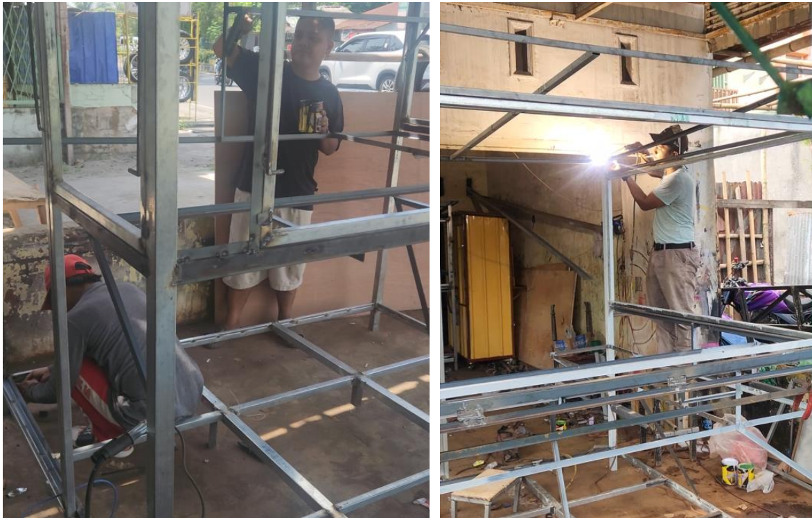
Gambar 5. Proses pengerjaan pembuatan kios UMKM di bengkel mitra Fakultas Teknik USU

Proses pembuatan kios ini diawali dengan pengadaan bahan-bahan yang diperlukan untuk pembuatan kios UMKM ini. Selanjutnya pengerjaan kios dimulai dari penggambaran bentuk kios hingga implementasi pengerjaannya. Proses pengerjaan hingga penyelesaian kios UMKM ini memakan waktu 4 minggu karena tingkat kesulitan yang cukup tinggi. Kegiatan ini juga melibatkan mahasiswa sekaligus meningkatkan keterampilan mahasiswa dalam pengenalan alat dan bahan serta cara-cara pengelasan besi. Karena pengerjaan dilakukan dengan Ikhlas dan senang hati maka proses pengerjaan berlangsung tanpa keluhan dari seluruh anggota tim.