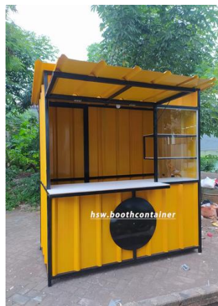
Gambar 4. Kios modern yang direncanakan akan dibuat oleh Tim PkM menggunakan bahan baja yang tahan lama sebanyak 4 buah berventilasi dan menunjang kemudahan pemasaran produk dipasang pada halaman Mesjid Al Ikhlas masing-masing sebanyak 4 unit

Tim PkM melakukan analisis pasar berkaitan dengan ketersediaan bahan baku untuk mewujudkan pekerjaan pembuatan dan instalasi kios pemasaran produk UMKM yang dapat mewakili 4 dusun. Kios yang akan dibangun merupakan kios modern yang menawarkan pasar yang lebih simple namun higienis dan kios yang diinginkan memang disesuaikan dengan kebutuhan warga dan ketersediaan dana dari hibah PkM USU (Joewono, et al. , 2021).