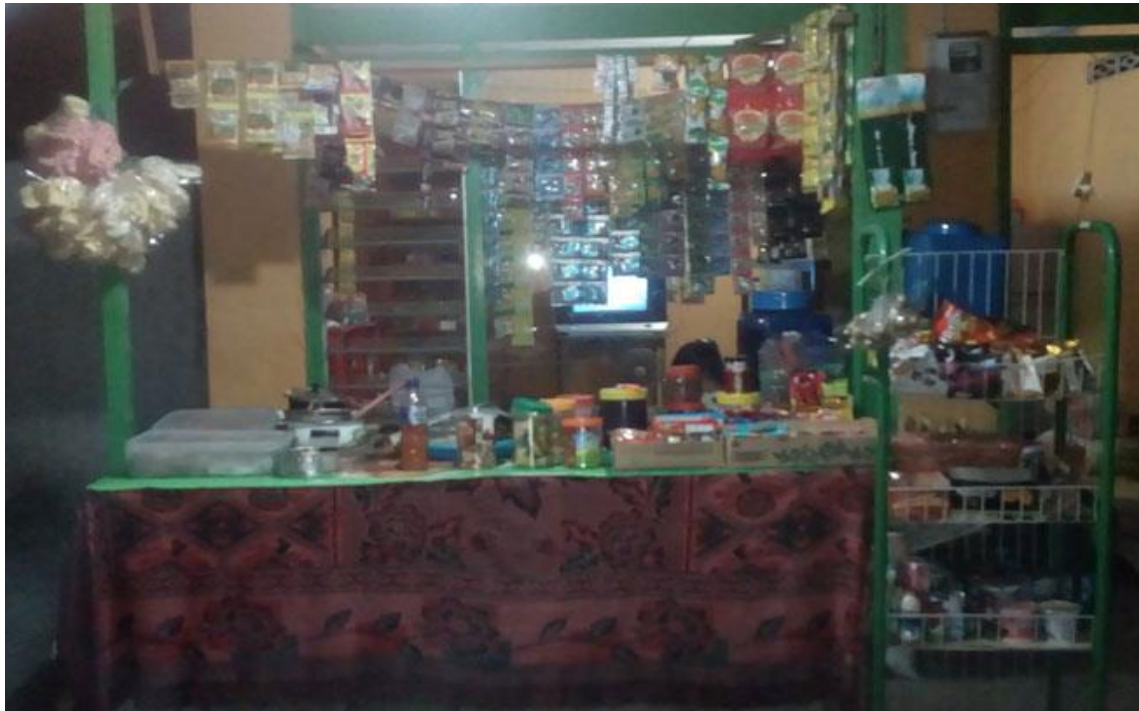
Gambar 2. Salah satu pemasaran produk panganan masyarakat di rumah warga Desa Tuntungan II

focused discussion group (FGD) yang melibatkan masyarakat desa sasaran berikut tokoh masyarakat dan kepala desa dan aparat desa. Dari hasil FGD diputuskan permasalahan prioritas untuk segera diatasi di desa sasaran. Berdasarkan hasil FGD, diperoleh mayoritas masyarakat sangat menginginkan pembuatan tempat pemasaran produk UMKM yang menampung produk-produk buatan masyarakat lokal berupa produk makanan untuk dapat dipasarkan yang dapat menambah pendapatan masyarakat. Selama ini masyarakat melakukan pemasaran produknya dari depan rumah, halaman rumah atau bahkan bagian dari rumahnya sendiri. Cara ini memiliki kelemahan pemasaran produk yang tersebar sehingga menyulitkan konsumen menemukan produk-produk mereka sehingga pemasaran produk UMKM stagnan tidak berkembang (Paramita dan Surur, 2022).