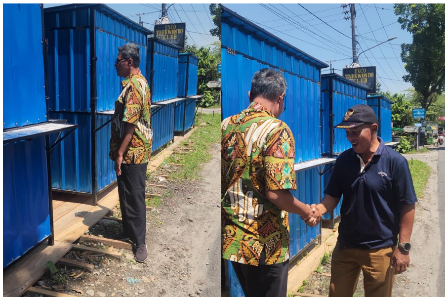
Gambar 6. Kios modern UMKM hasil kegiatan Tim Pelaksana PkM USU 2025 yang menghasilkan 4 buah kios berukuran 1.5 m x 2 m

Proses pembuatan kios ini diawali dengan pengadaan bahan-bahan yang diperlukan untuk pembuatan kios UMKM ini. Selanjutnya pengerjaan kios dimulai dari penggambaran bentuk kios hingga implementasi pengerjaannya. Proses pengerjaan hingga penyelesaian kios UMKM ini memakan waktu 4 minggu karena tingkat kesulitan yang cukup tinggi. Kegiatan ini juga melibatkan mahasiswa sekaligus meningkatkan keterampilan mahasiswa dalam pengenalan alat dan bahan serta cara-cara pengelasan besi. Karena pengerjaan dilakukan dengan Ikhlas dan senang hati maka proses pengerjaan berlangsung tanpa keluhan dari seluruh anggota tim.