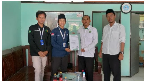
Gambar.3 Serah Terima Website

Sebagai tahapan akhir dari pelaksanaan program pengabdian kepada masyarakat, dilakukan kegiatan serah terima Website Portofolio MTsS. Hidayatun Najah beserta video panduan pengelolaan kepada pihak sekolah. Kegiatan ini dihadiri oleh Kepala Madrasah, guru, staf tata usaha, serta rekan tim KKN Posko 06, seperti pada Gambar.3 berikut.