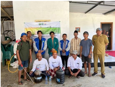
Gambar 1. Dokumentasi Kegiatan Penyuluhan Pembuatan ZPT Rebung Bambu

penyuluhan, yang bertujuan untuk meningkatkan keterampilan mereka dalam memproduksi ZPT secara mandiri guna mendukung pertumbuhan tanaman secara optimal. Di bagian depan, terlihat beberapa bahan dan hasil pembuatan ZPT yang telah disiapkan sebagai contoh praktik bagi para peserta. Melalui penyuluhan ini, diharapkan para petani mampu memanfaatkan bahan alami di sekitar mereka, seperti rebung bambu, untuk meningkatkan hasil pertanian sekaligus mengurangi ketergantungan pada produk kimia pabrikan.