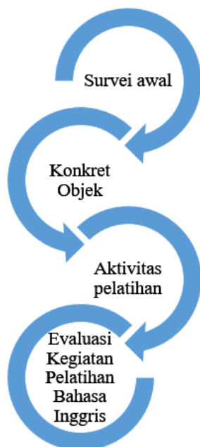
Gambar 1. Rancangan Tahapan Pengabdian