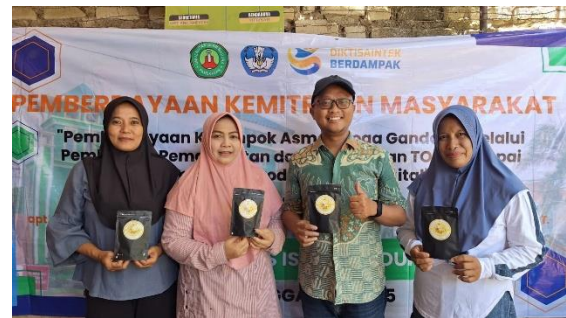
Gambar 2. Hasil Produksi

terukur. Sebelum kegiatan, 100% pemanfaatan TOGA hanya berupa rebusan tradisional. Setelah pelatihan, peserta mampu mempraktikkan teknik pengolahan pascapanen dan berhasil memproduksi 3 jenis produk serbuk minuman fungsional, yaitu jahe, kunyit, dan temulawak, dengan total produksi awal mencapai 5 kilogram gambar 2. Tingkat partisipasi mitra dalam setiap tahapan kegiatan juga sangat tinggi, ditunjukkan dengan kehadiran rata-rata 95% dari total 15 pengurus dalam setiap sesi, serta keterlibatan aktif dalam diskusi dan praktik (Kusuma et al., 2025).