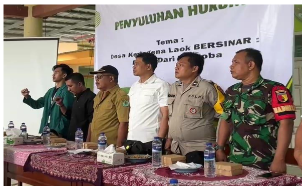
Gambar 2. sosialisasi penyuluhan

Setelah kegiatan penyuluhan dilaksanakan, hasil post-test menunjukkan peningkatan yang signifikan, yakni sebesar 87%. Peningkatan ini mencerminkan keberhasilan program penyuluhan yang dilakukan melalui metode sosialisasi, diskusi, dan tanya jawab. Kegiatan tersebut terbukti efektif dalam meningkatkan kesadaran dan pemahaman masyarakat tentang bahaya narkoba dan judi online. Dengan demikian, penyuluhan ini memberikan dampak positif yang nyata bagi warga Desa Kertagenah Laok, terutama dalam membangun pola pikir yang lebih waspada terhadap ancaman penyalahgunaan narkoba dan praktik perjudian.